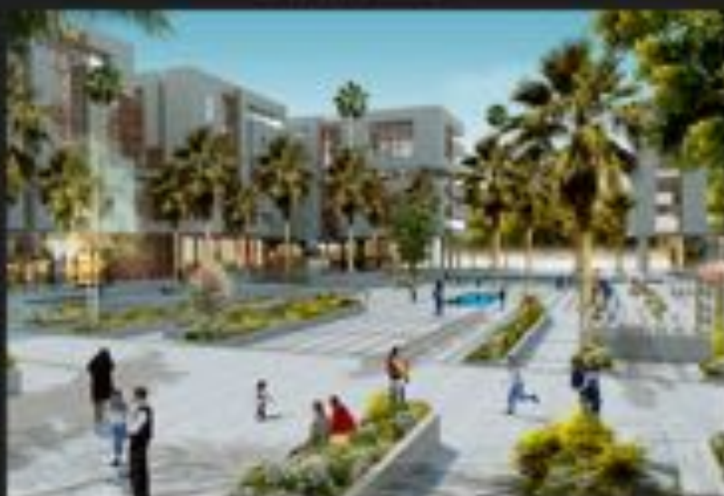
WIND CENTER À RABAT