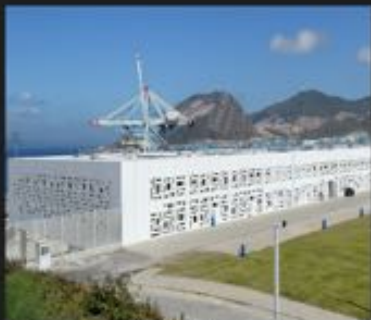
CTI TANGER MED