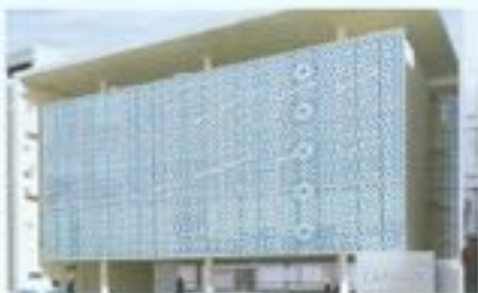
SIEGE CAFRAD RABAT MAROC

Par rapport à la certification ISO, il y a quelques années de cela qu'on est certifié. On était malheureusement les seuls au Maroc et en Afrique. A l'époque, mon idée était de déclencher ce processus avec l'ensemble de mes confrères et consorts, pour que plusieurs agences soient certifiées ISO. Je n'ai pas d'information sur 2016, mais j'espère que la certification s'est développée, ce qui permettra d'avoir une dimension internationale et d'avoir des relations à travers le monde entier. La certification, aujourd'hui, permet de créer de bons liens professionnels. Par rapport au trophée que j'ai eu le plaisir et l'honneur de recevoir, je suis très content et je remercie sincèrement NOV AFRIQUE d'avoir pensé à moi. En toute honnêteté, mon idée c'est de créer un lien fort entre le Maroc et l'Afrique car l'avenir de l'Afrique c'est le Maroc et l'avenir du Maroc c'est l'Afrique.