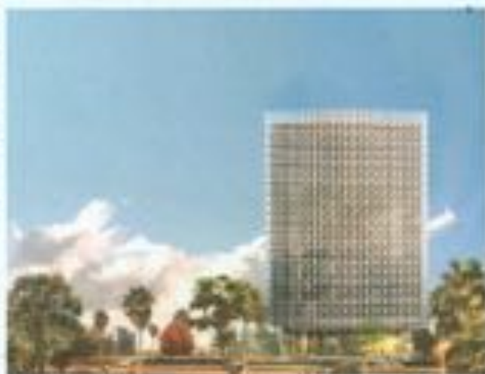
SIEGE MEDIA CONTACT COTONOU BENIN