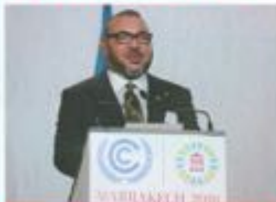
Discours Royal au COP 22