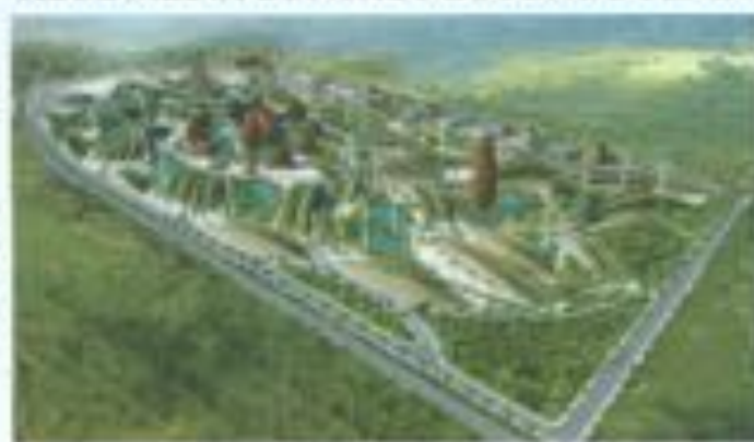
COTONOU SHORE BENIN