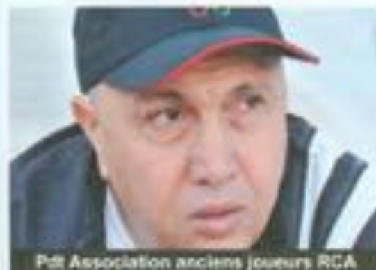
Pdt Association anciens joueurs RCA