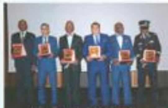
Lauréats Prix Padel 2016