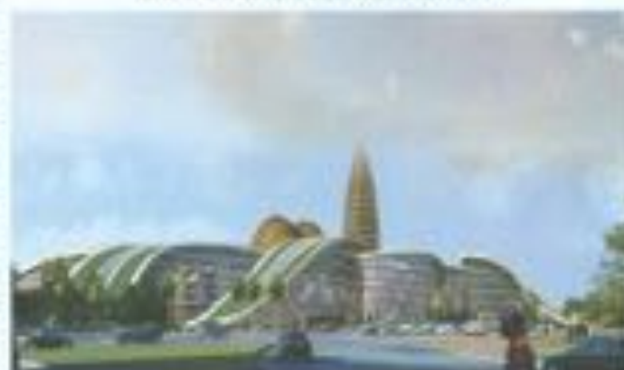
BENIN SMART CITY COTONOU