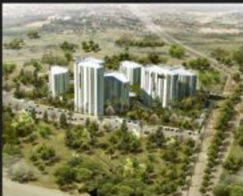
SIÈGE ANCYCC À RABAT