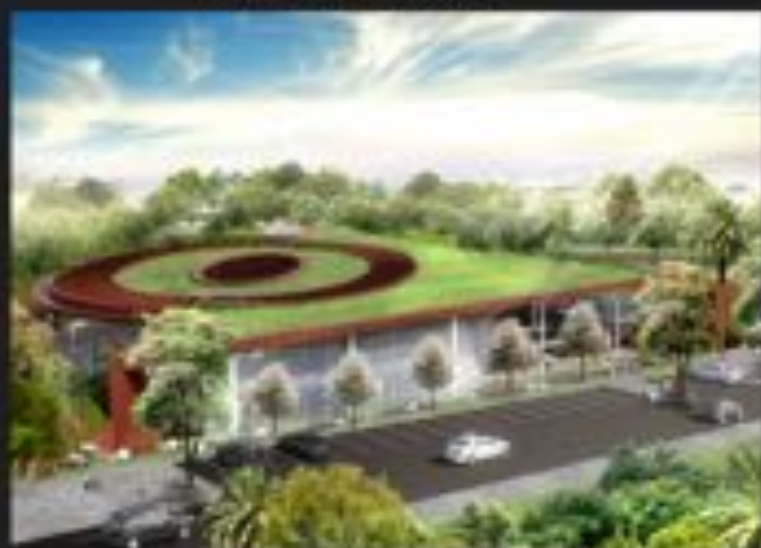
SIÈGE FONDATION OCP À RABAT