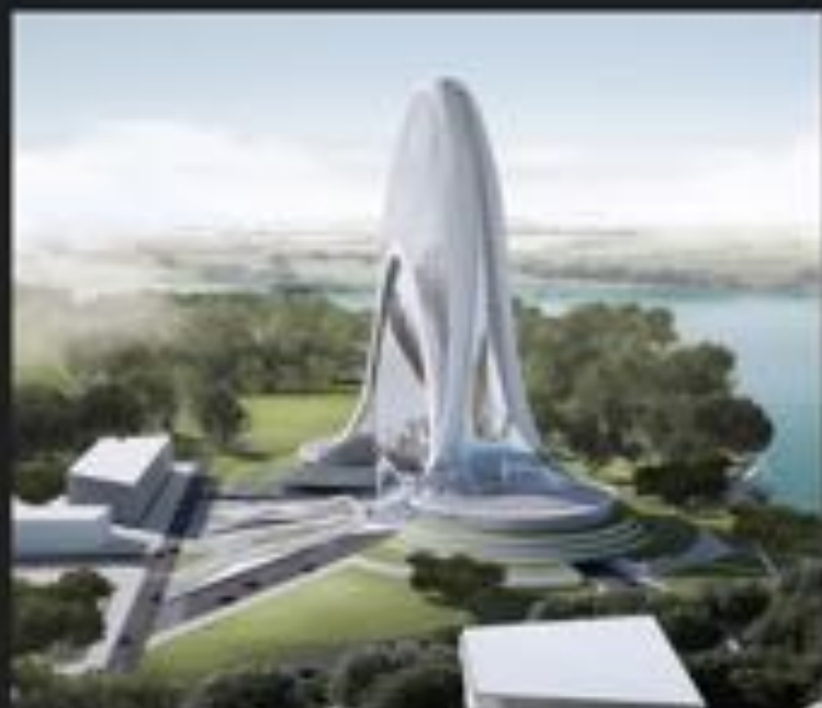
TOUR BANCAIRE À RABAT (CONCOURS)