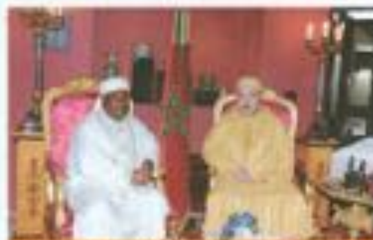
Discours L'urgence de Moderniser la Ressource