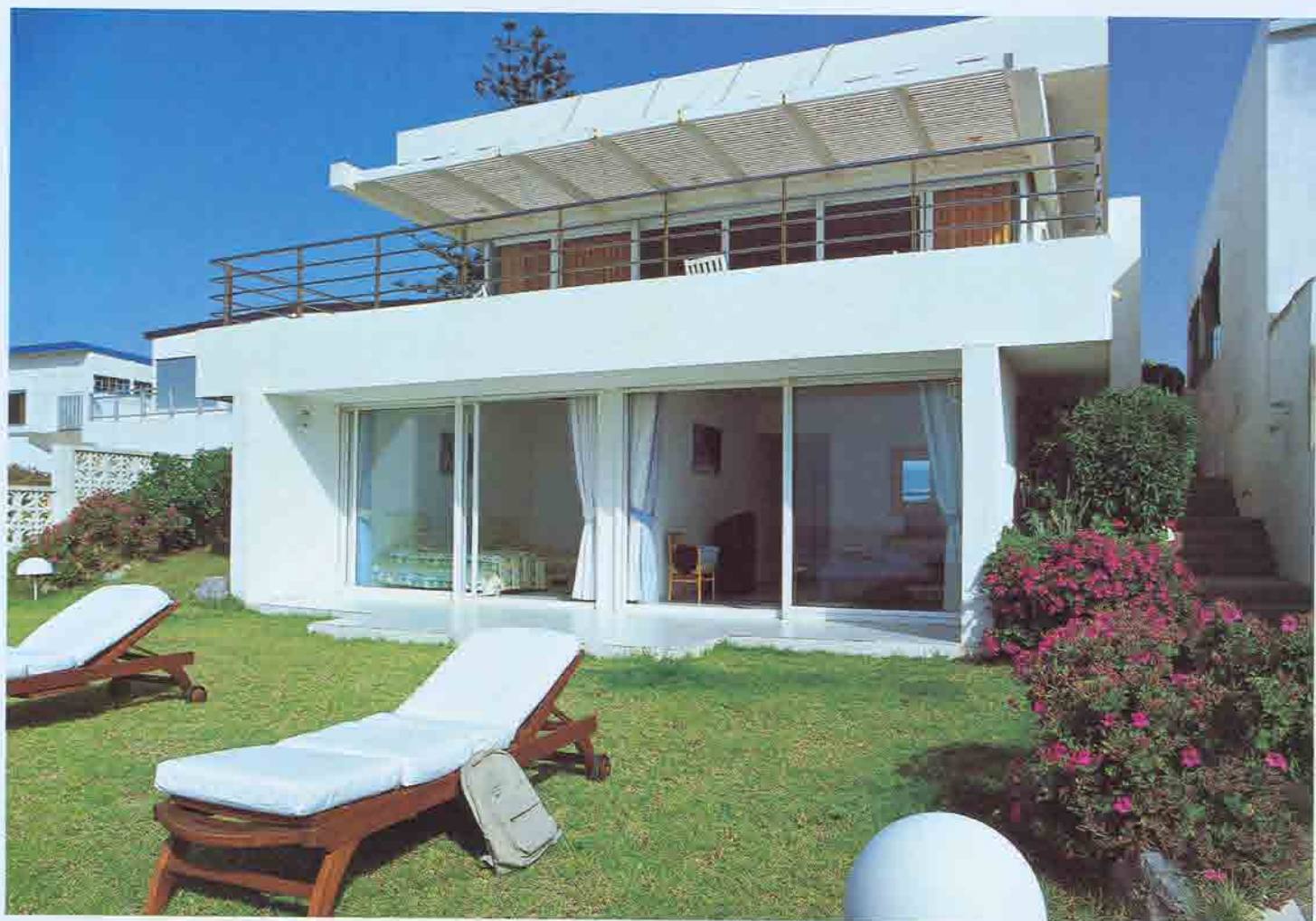
Telle le pont supérieur d'un paquebot, la terrasse semble suspendue entre ciel et terre et profite d'un panorama exceptionnel.