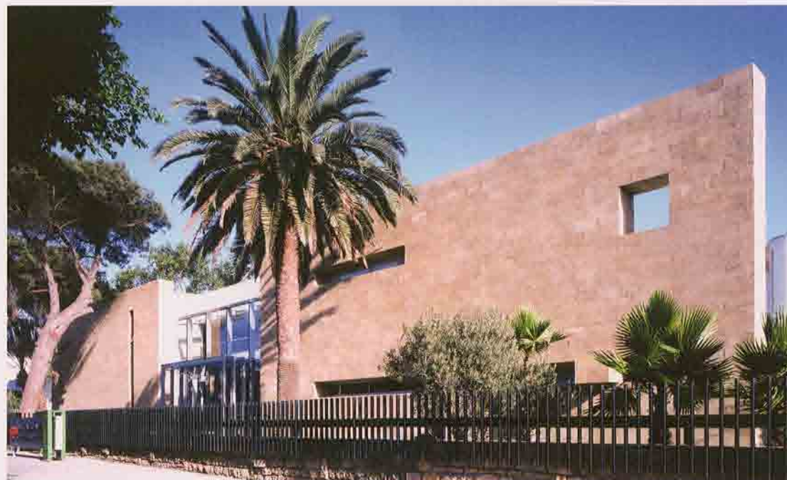
Le bâtiment du CRI, une intégration réussie

C'est sur l'avenue de la Victoire que quelques demeures des années cinquante survivent, bordées ou nichées dans une végétation luxuriante, souvenirs d'une architecture et d'un urbanisme réussi du début du vingtième siècle. C'est en effet à cette époque que l'on s'est soucié scrupuleusement de l'intégration urbaine, du respect des proportions et des reculs plantés.