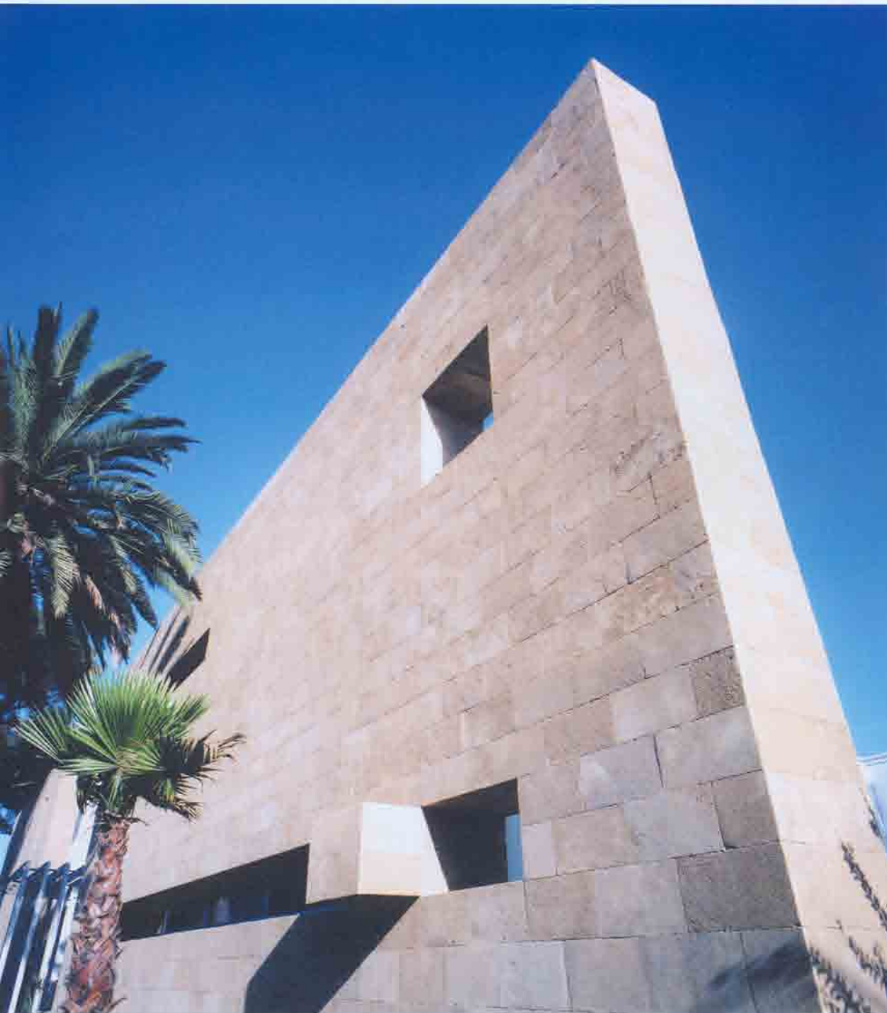
Détail du mur en pierre. Un appareillage et des percements réussis.