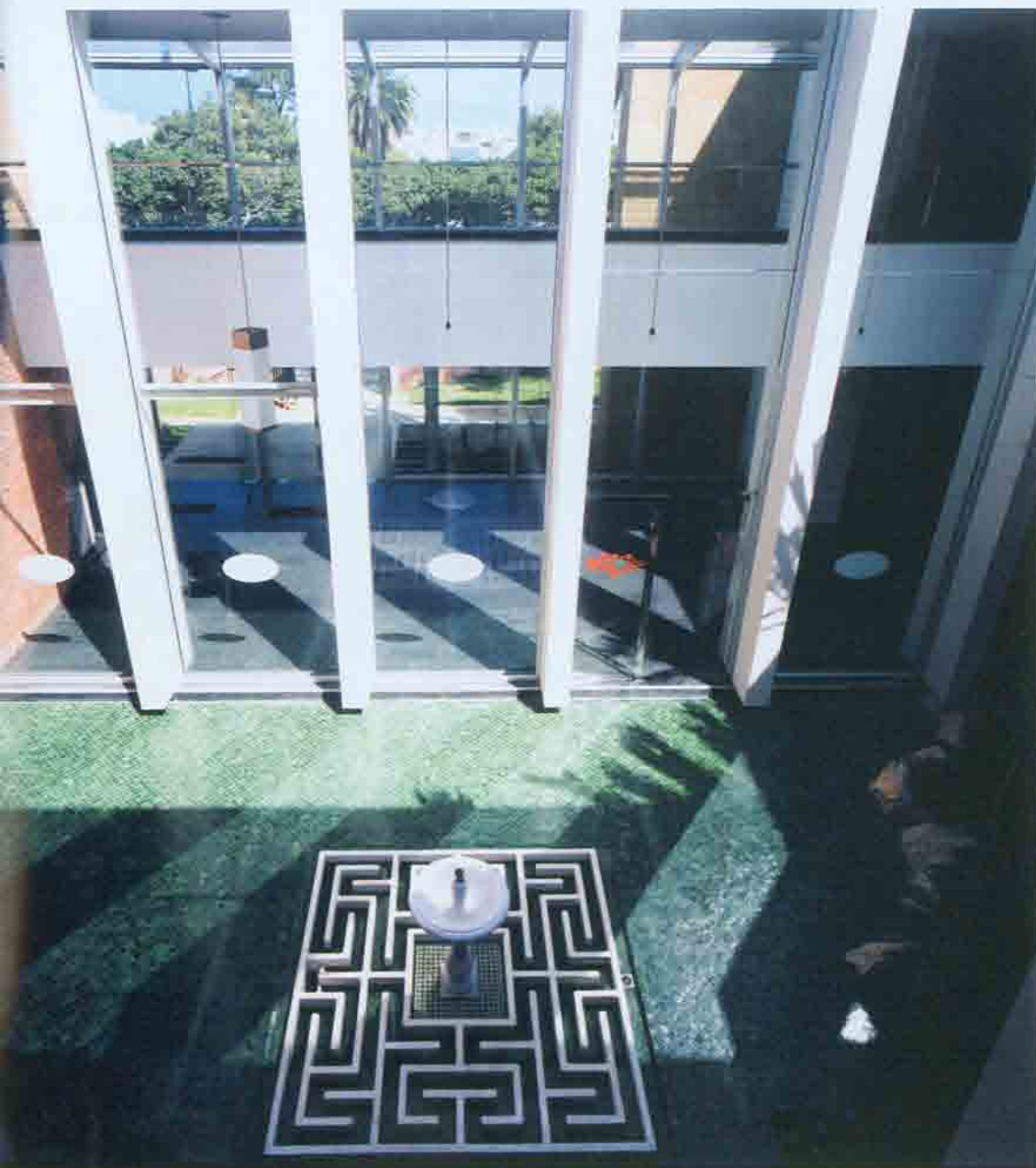
Le patio intérieur est un clin d'oeil à l'architecture traditionnelle

On découvre donc que pour ancrer le bâtiment dans le site, un véritable écran extérieur en pierre, sur tout le long de la façade a été réalisé, habillé de panneaux de pierre à l'aspect et à la couleur d'un rempart. Par ailleurs, l'utilisation du verre et du métal vient contraster avec l'opacité de ce mur, et modifie ainsi le caractère des espaces intérieurs en leur conférant clarté et légèreté.