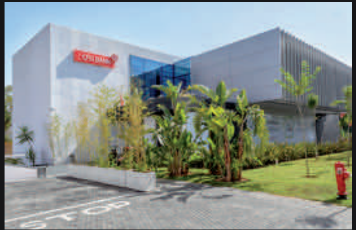
Agence CFG Group - Rabat