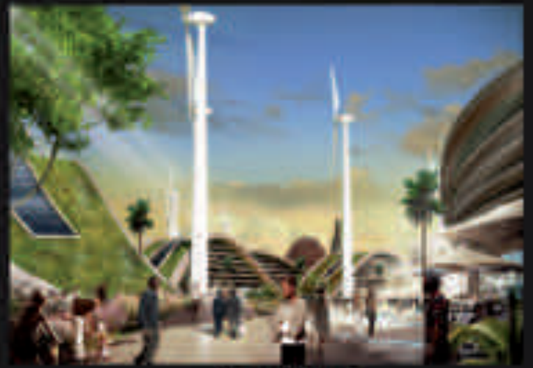
COORDONATION DES BÂTIMENTS