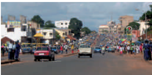
DOSSIER GUINEE BISSAU