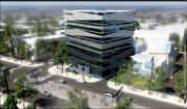
MAINTIEN DE LA QUALITÉ DE VIE DANS LE QUARTIER