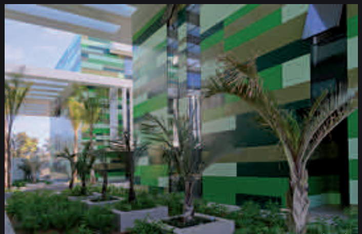
Zenith - Rabat