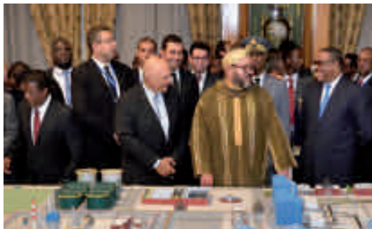
Les visites du roi Mohammed VI: