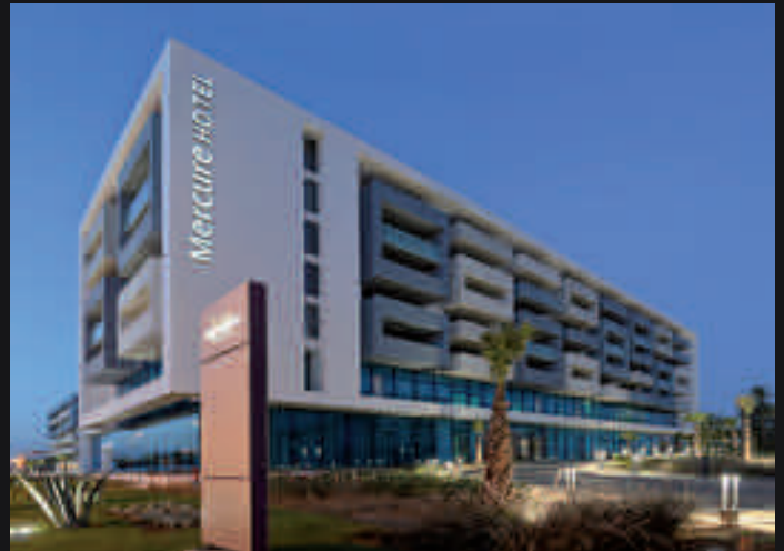
Hôtel Mercure - Nador