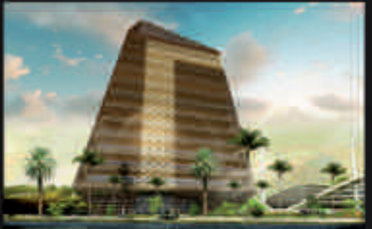
COORDONATION DES BÂTIMENTS