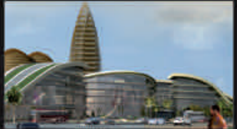
MAINTIEN DE LA QUALITÉ DE VIE DANS LE QUARTIER