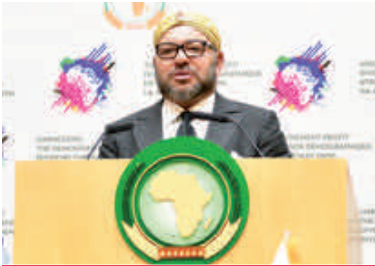
Discours Royal au 28 eme sommet de l'UA