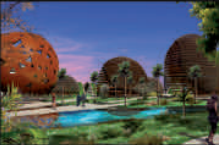
COORDONATION DES BÂTIMENTS