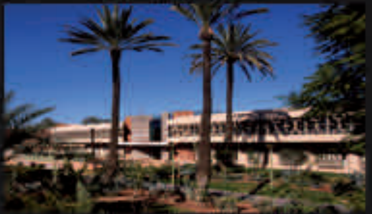
MAINTIEN DE LA QUALITÉ DE VIE DANS LE QUARTIER