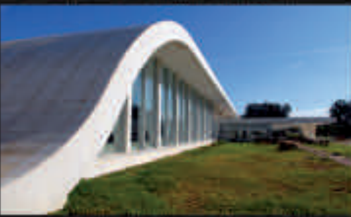
MAINTIEN DE LA QUALITÉ DE VIE DANS LE QUARTIER