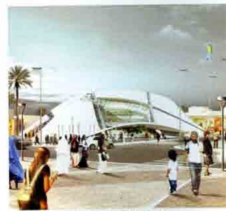
Troisième Prix – Taoufik El oufir Architectes