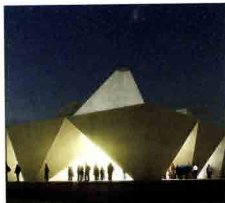
Premier prix – Groupement Omar Kobbité & EGA