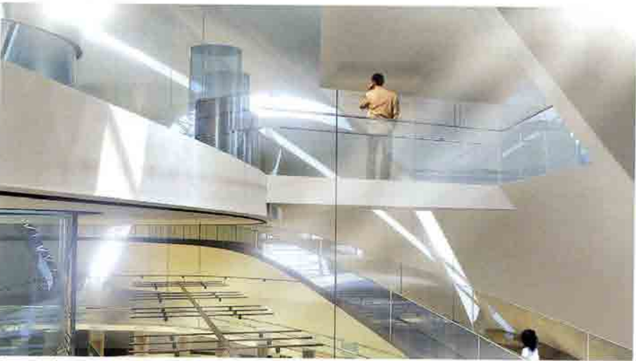
Connexion logistique entre administration et zone d'exposition