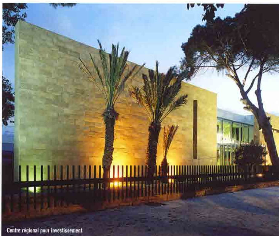
Centre régional pour Investissement