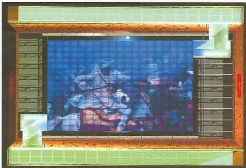
Vue du plafond du stand. Image de synthèse